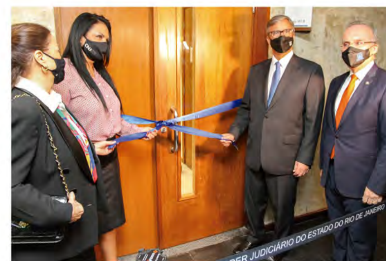
Inauguração do Centro Especializado de Atenção e Apoio às Vítimas de Crimes e Atos Infracionais

O espaço, localizado no 1º andar do Fórum Central, funciona como um canal especializado de atendimento, acolhimento e orientação de forma processual e psicológica às vítimas de crimes e atos infracionais.