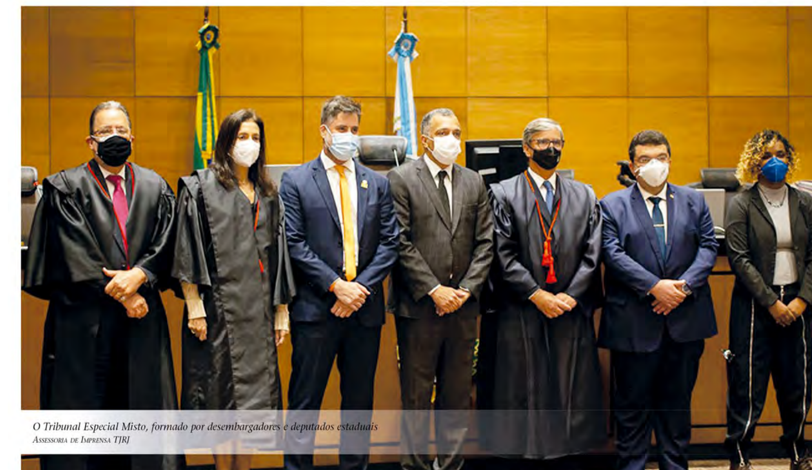
O Tribunal Especial Misto, formado por desembargadores e deputados estaduais

de responsabilidade. Com a condenação, Witzel perdeu o cargo de governador e fica inabilitado para o exercício de função pública pelo prazo de cinco anos.