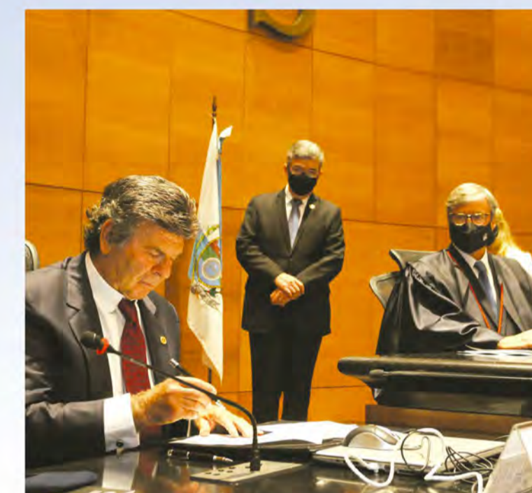
Lançamento Justiça 4.0, com o presidente do CNJ, ministro Luiz Fux (2021)