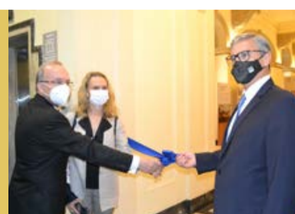
Para saber mais sobre as exposições do Museu da Justiça, acesse

A mostra relembra e informa sobre epidemias que atingiram a cidade do Rio de Janeiro ao longo de sua história até os dias atuais e propõe uma reflexão sobre o papel dos agentes públicos, da sociedade e do Poder Judiciário no enfrentamento destes males.