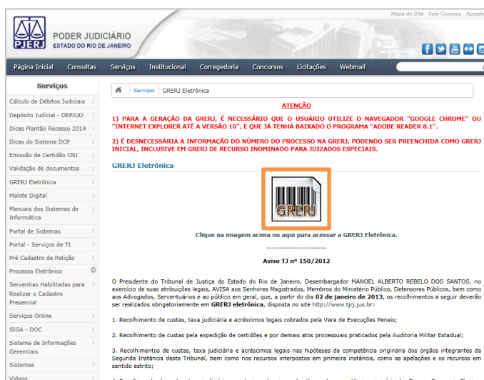
Figura 2 - Clique em GRERJ.