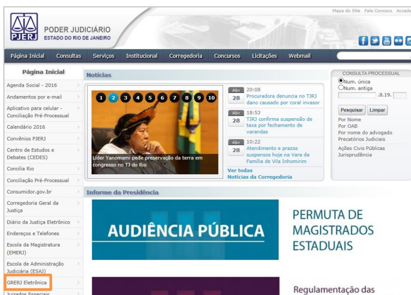
Figura 1 - Menu GRERJ Eletrônica.

Para iniciar a utilização do sistema acesse o portal http://www.tjrj.jus.br e clique no menu GRERJ Eletrônica .