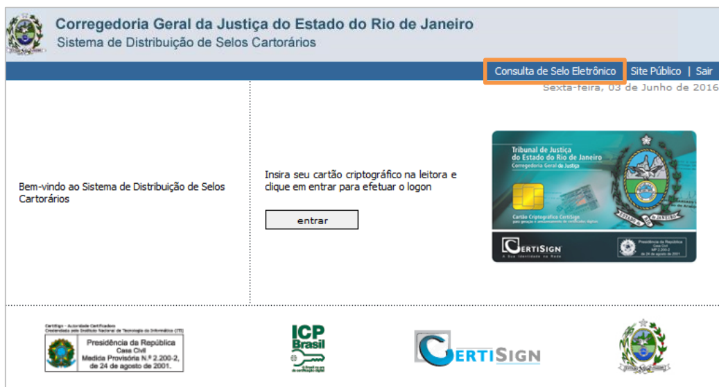
Figura 46 - Clique em Consulta de Selo Eletrônico.