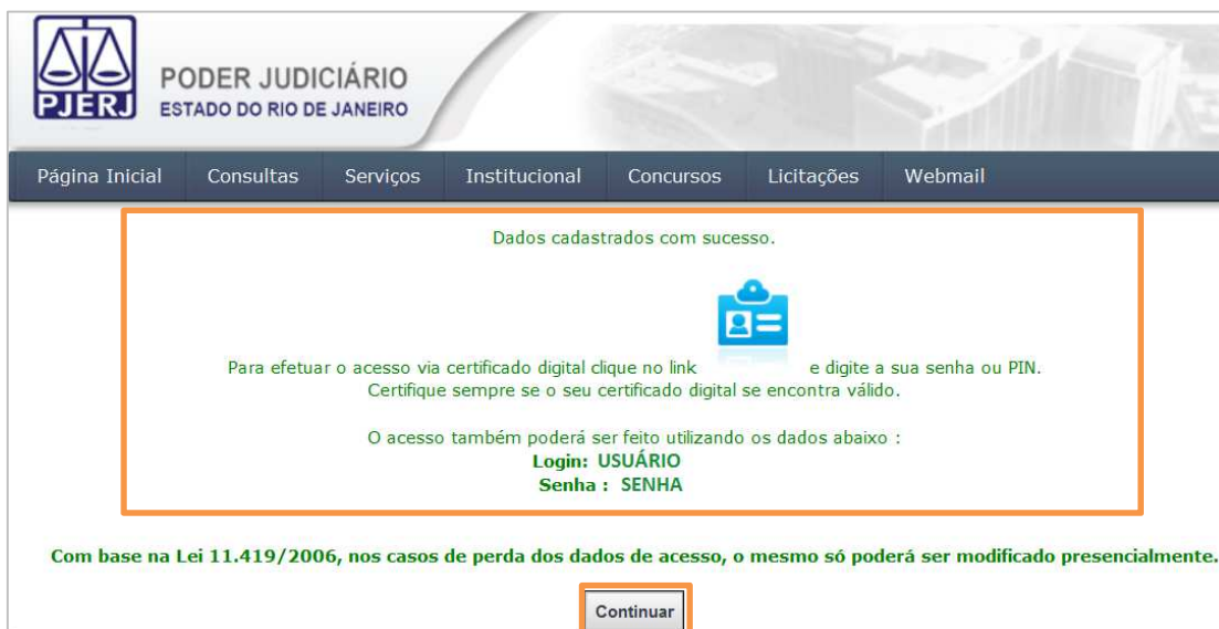
Figura 6 – Mensagem de confirmação do cadastro e orientações de acesso.

O usuário será redirecionado para o Portal de Serviços.