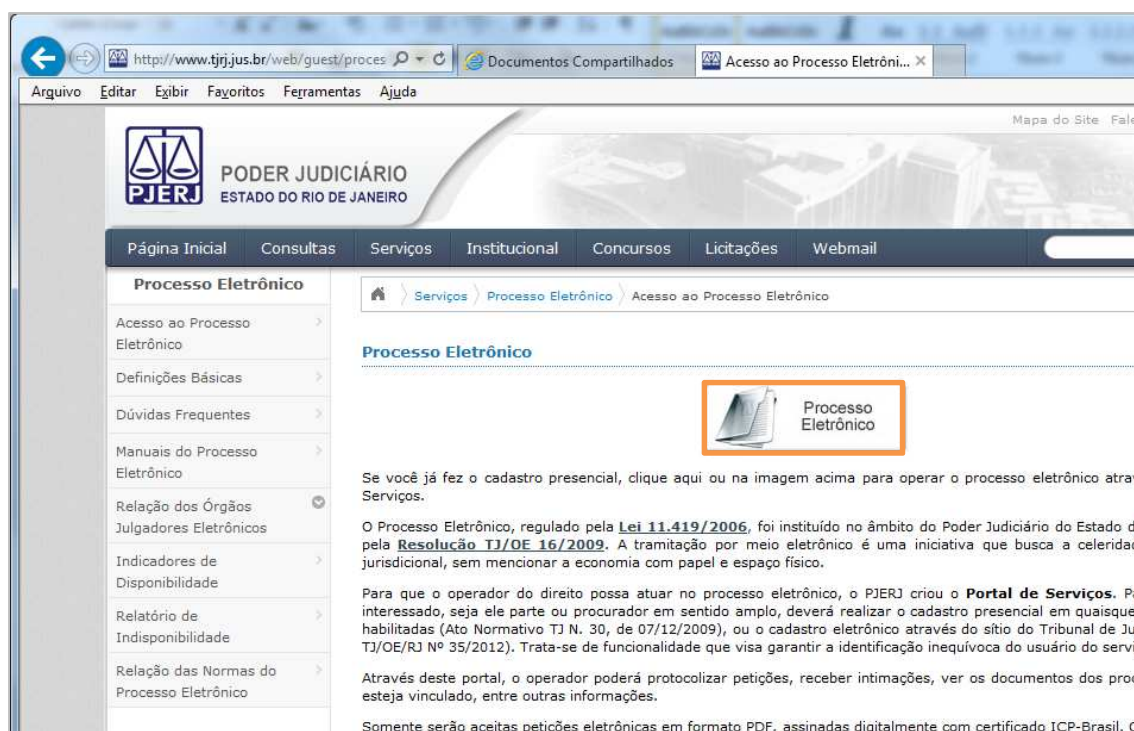
Figura 2 – Botão Processo Eletrônico.

Em seguida, clique no botão Processo Eletrônico na parte superior ao texto.